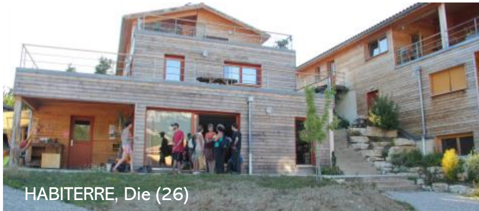
HABITERRE, Die (26)