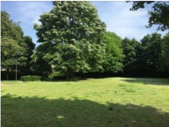
Notre futur terrain, square Roger Jourdain