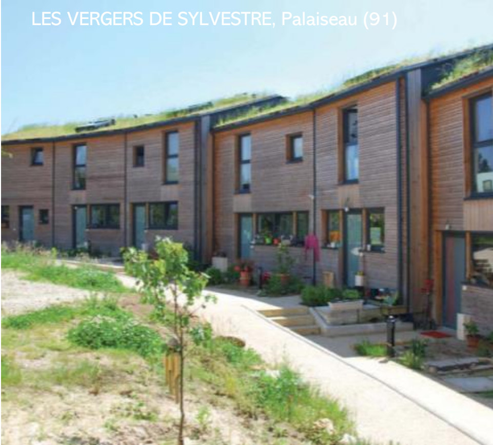
LES VERGERS DE SYLVESTRE, Palaiseau (91)